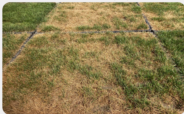
Unbehandelt mit Trockenstress

Reaktion des Rasens unter kontrollierten Trockenheitsbedingungen