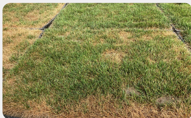
Fiata® Boost (150 g/ha) – 28 Tage nach der Anwendung

Fiata® Boost verbesserte die Rasenfarbe und -regeneration unter anhaltendem Trockenstress und zeigte damit eine erhöhte Toleranz gegenüber abiotischen Stressbedingungen.