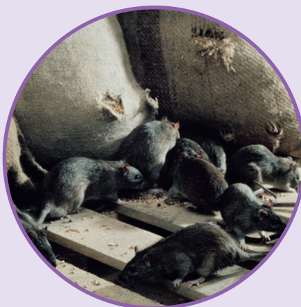
RAT NOIR Rattus rattus