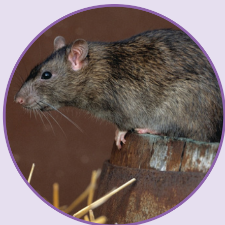
RAT BRUN Rattus norvegicus