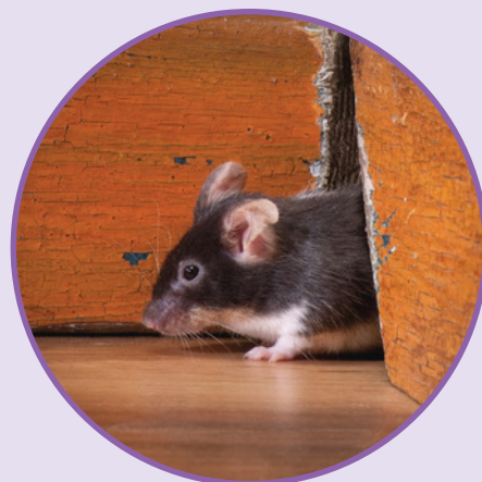
SOURIS COMMUNE Mus musculus