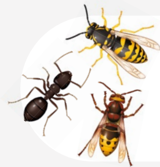
Guêpes, frelons et fourmis Wespen, hoornaars en mieren

Utilisation: lire les instructions d'utilisation ci-jointes avant emploi.