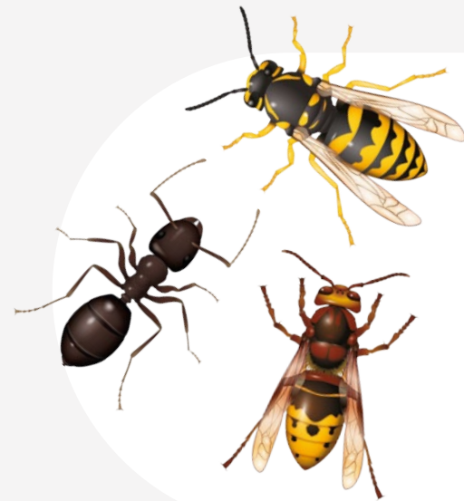
Guêpes, frelons et fourmis Wespen, hoornaars en mieren